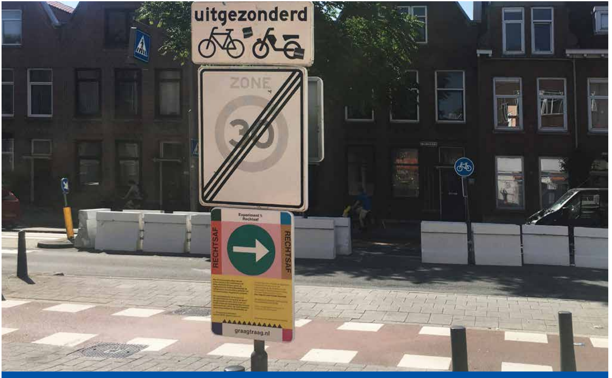
Maatregel op de Beukelsdijk ter hoogte van de Jagthuisstraat: tijdelijk kan je alleen rechtsaf.

Wat kan je doen als je de verkeersveiligheid wilt verbeteren in je straat, maar een harde ingreep zoals een drempel geen optie is? Bewonersinitiatief Beukelswijk (graagtraag.nl) boog zich over deze kwestie en kwam met een uitgebreide lijst aan visuele ideeën waarvan er zeven experimentele maatregelen op de Beukelsweg en -dijk werden uitgevoerd.