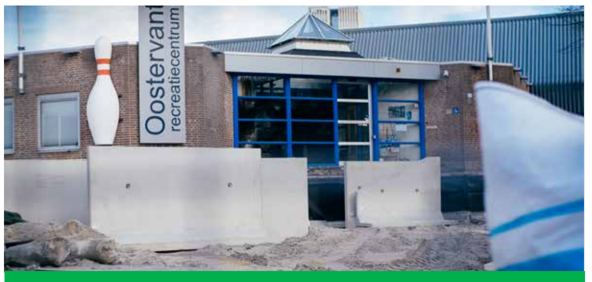
De werkzaamheden rondom het Oostervant zijn van start gegaan.

Jarenlang was het stenige Oostervantplein een doorn in het oog voor menig bewoner en bezoeker, maar daar komt nu eindelijk verandering in. De buitenruimte die rondom Recreatiecentrum Oostervant gelegen is, ondergaat een groene