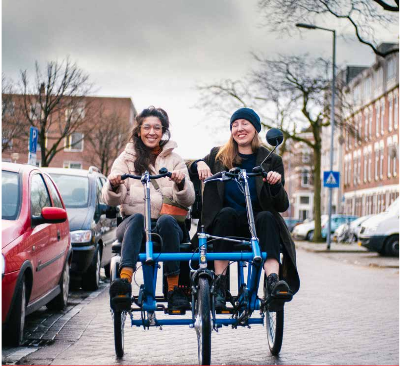
De duo-fiets in actie.

De Unie heeft Huize Middelland gevraagd of zo'n fiets ook in Middelland kan staan. Dat was natuurlijk echt een kolfje naar de hand van het Recreatiecentrum Oostervant. Sinds de zomer staat in de parkeergarage onder het Oostervant de duo-fiets en kan die worden gebruikt.