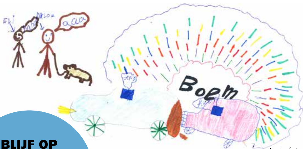
Louise (7 jaar)