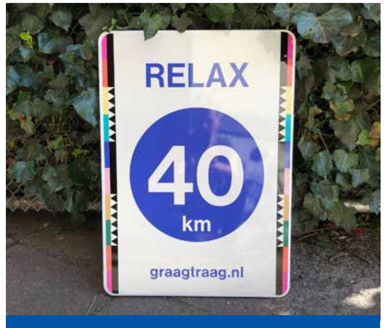
Een bord van het 40 km experiment.

25 km/uur. Ook opmerkelijk is dat de snelheid van de uitschieterende hardrijders door bewoners veel hoger wordt ingeschat dan deze daadwerkelijk is. Dit komt vooral door de geluidsoverlast die het geeft. “Maar die ene procent hardrijders vormt natuurlijk nog steeds een probleem”, aldus Jörgen. Gelukkig hebben de experimenten nu al vaste voet aan de grond gekregen: uit een enquête blijkt dat op specifieke punten het gevoel van verkeersveiligheid is gestegen (74%) en de gemiddelde snelheid in de straat dalende is.