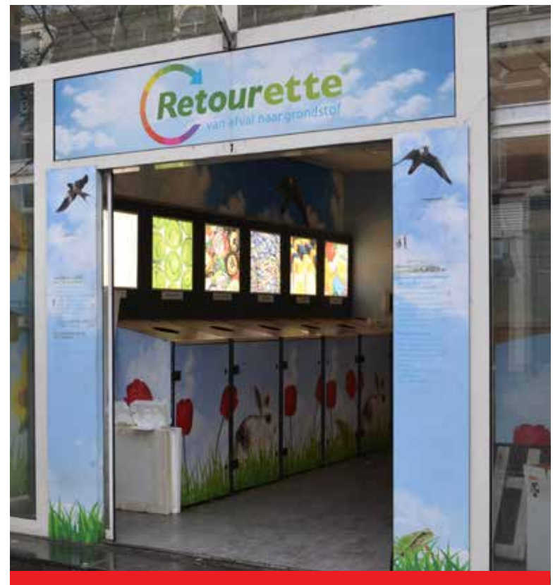
De Retourette aan de Nieuwe Binnenweg.