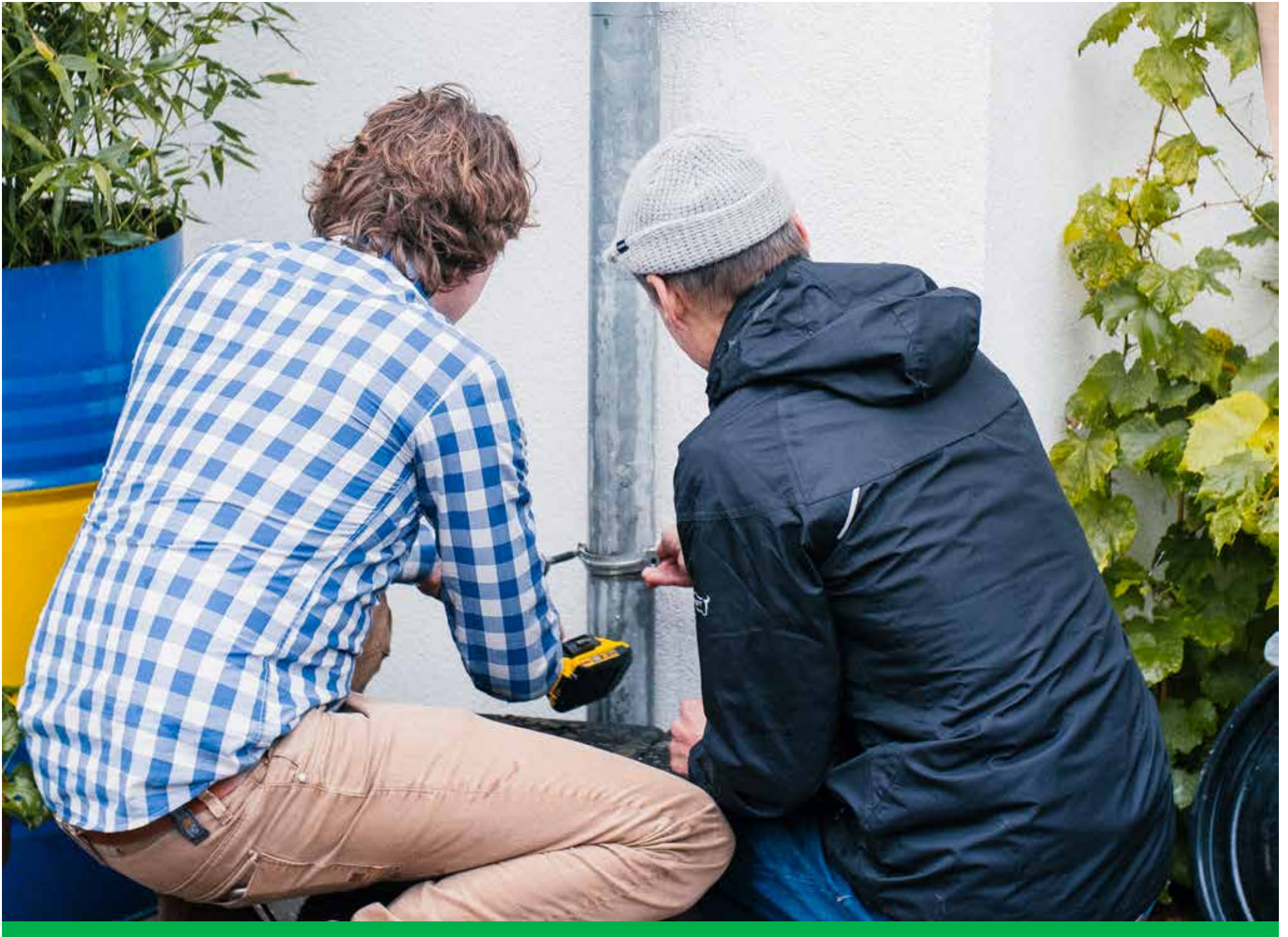
De eerste regenton van de duizend. Te vinden aan de Witte van Haemstedestraat.

In het programma 'Mooi, Mooier, Middelland; We Gaan Door!' neem duurzaamheid een belangrijke plaats in. Er is een speciaal team Duurzaam Middelland (DuZa). Het team denkt na over de toekomst, de veranderingen van het klimaat en hoe Middelland hiermee kan omgaan.