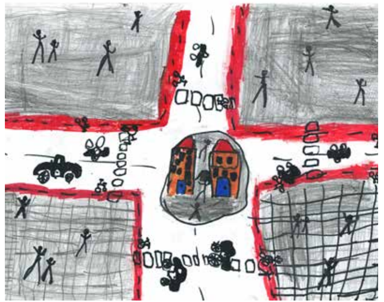
Verkeerssituatie kruising Nieuwe Binnenweg-Claes de Vrieselaan - Saar (7 jaar)