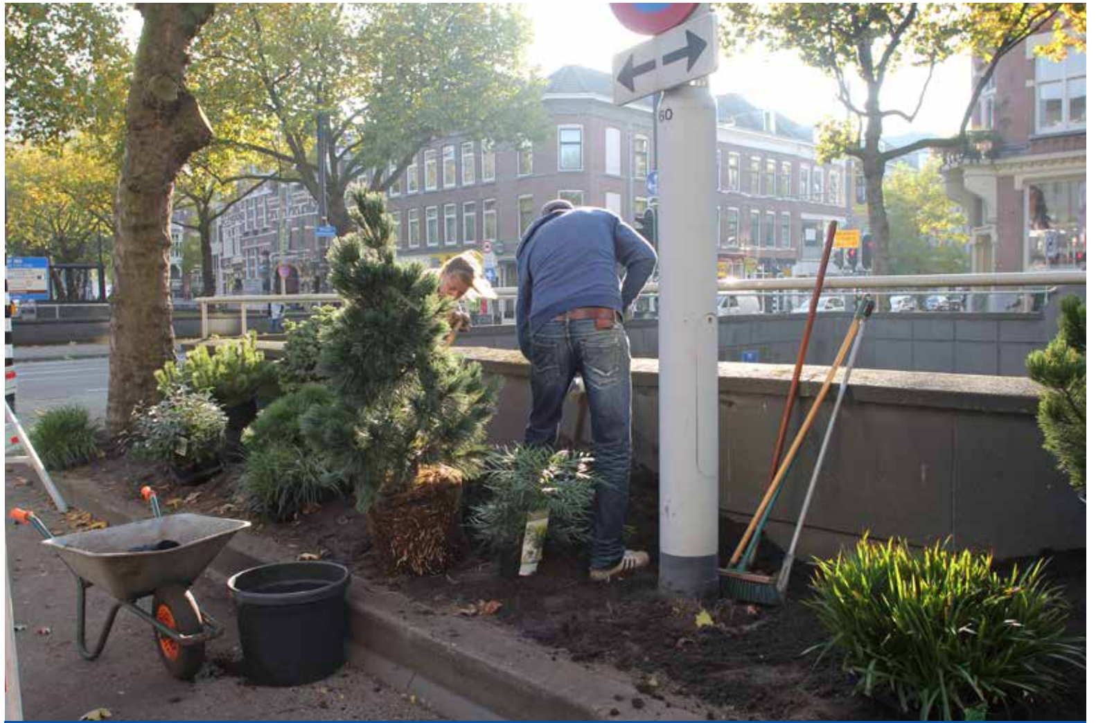
De aanleg van de proefstrook met planten die fijnstof opvangen bij de kruising 's Gravendijkwal-Nieuwe Binnenweg door Stadslab Luchtkwaliteit.