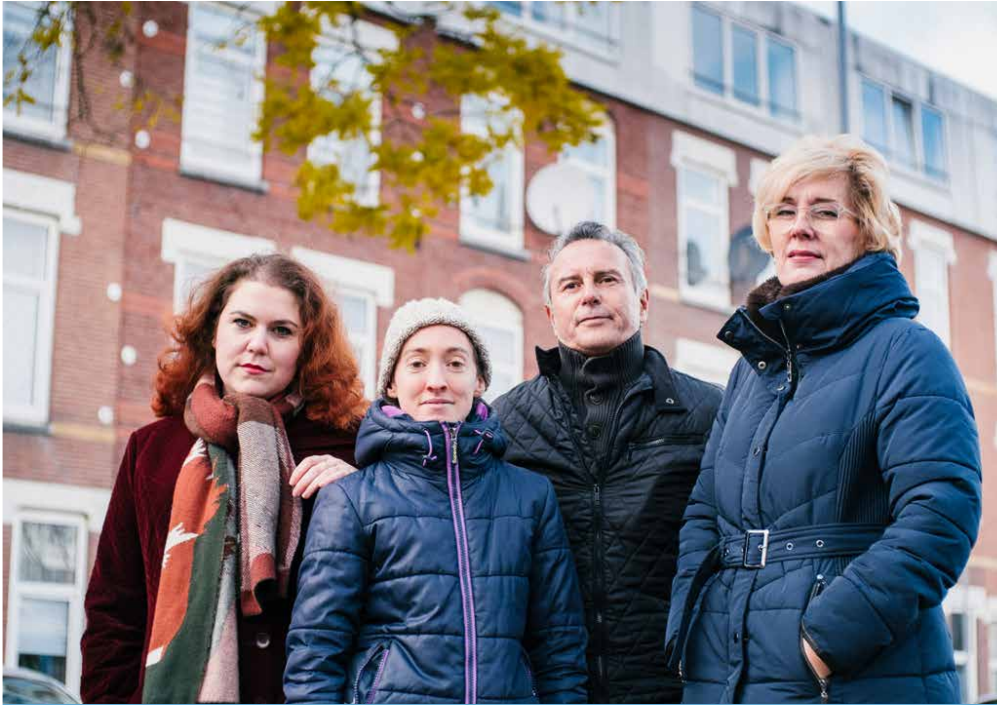
Deel bewonersgroep Oostervantkwartier.