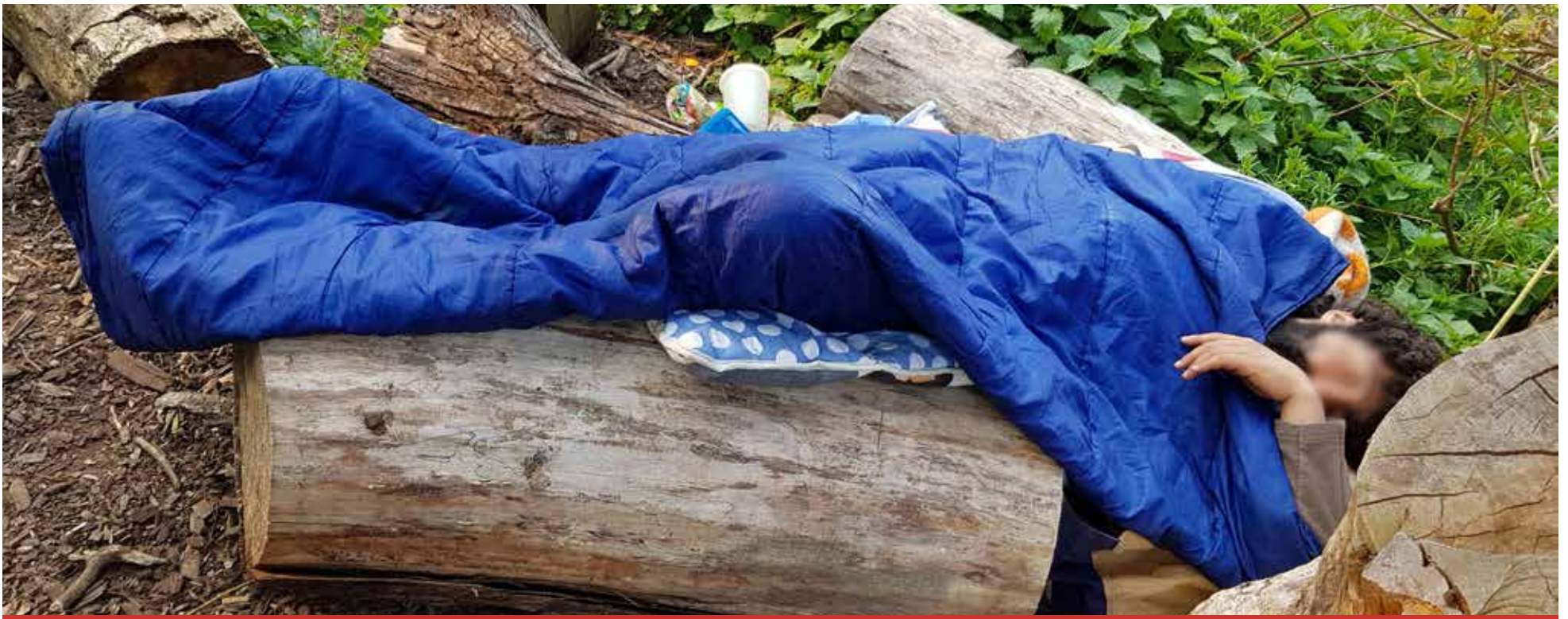
Een slaper in de Spoortuin tijdens de koude dagen van april dit jaar.

Zomer! Het bruist in Middelland. Je kunt nu zelfs kamperen in de wijk. Zo is er 12-14 juli de stadscamping in het Brancopark en vanaf 8 augustus mag je de tent opzetten bij het Dierenlandje. Stadskamperen is spannend en helemaal hip. Maar elke nacht zijn er in Middelland ook mensen die onvrijwillig buiten slapen: de Middelland-wildkampeers. Wie zijn zij, wat is hun verhaal, en wat kan je doen als je een buitenslaper tegen het lijf loopt?