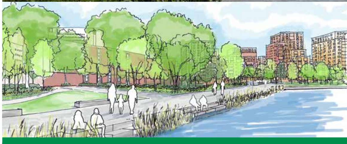
De stenige Coolhaven transformeert tot Stadspark. Foto: Robert Jager, impressie: Juurlink (+) Geluk

soorten dieren aantrekt", omschrijft Iris, "bijen komen af op de honing van de lindebloesem, vogels maken nesten in de bomen en in het riet aan de waterkant." De wilde beplanting aan de oevers van de Coolhaven blijft dan ook bestaan: Iris: "Leuke dingen houden we zo."